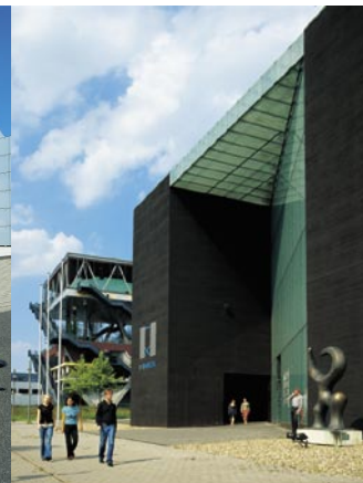
_Die Nachbarn | FH Design + Medien | Finbox | BMW | und viele mehr