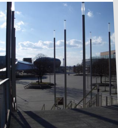
_in der Nähe der Expo Plaza

Ein Standort der nicht vergleichbar ist, einmalig und unverwechselbar, modern, innovativ, servicefreundlich, mit hohem Freizeitwert in der Region und einer vielfältigen Kunst und Kulturszene - eine attraktive Adresse in Deutschland, mitten in Europa!